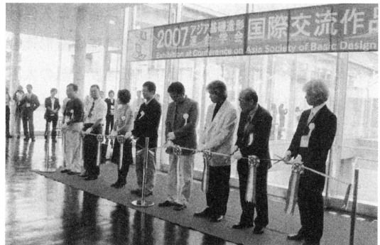
筑波大学総合交流会館

員の作品展を同時に開催、2007年アジア基礎造形連合学会筑波大会は、平成19年8月25日（土）～26日（日）筑波大学で開催、アジア基礎造形連合学会筑波大会作品発表展は、学会に先立って、2007年8月20日（月）～26日（日）まで筑波大学総合交流会館に展示された。